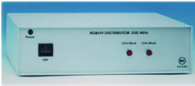
HL - HOUSING